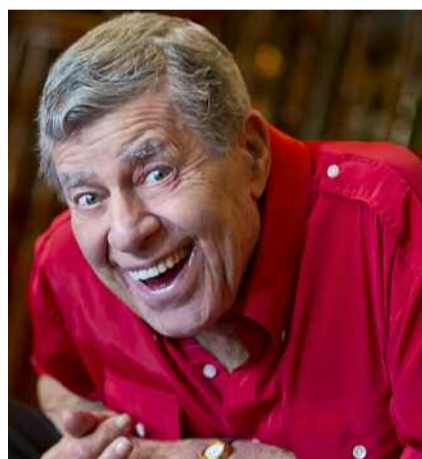
È mancato all'età di 91 anni

www.jorgepanchoaga.com ; www.sustainablemountainart.ch ; www.verzascafoto.com