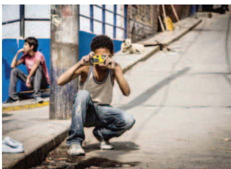
Cette photo du jeune Tatin a été prise par Luana Letts. Il s'agit des coulisses d'un de ses projets culturels au Pérou. LUANA LETTS

comment le paysage a été transformé par l'homme.» La candidature de cette artiste a ainsi touché la Fondation pour le développe-