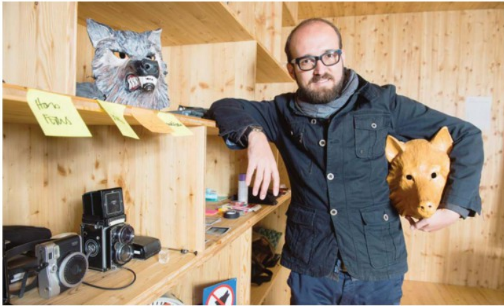
Le photographe colombien Juan Arias a cherché à tirer le portrait des Valaisans à travers la figure du loup. HÉLOÏSE MARRET

L'auteur et musicien martiniquais Pat Genet présente son premier recueil de poèmes, «Animal torpédo», publié aux éditions genevoises Coursu Moche, à la Cabine à Sion (rue de l'Industrie 40), en collaboration avec la Librairie Pavet. Une poésie au scalot, qui incise au plus près des lés, qui déchiffre la douleur des sutures. Dès 17 h. www.coursuouche.com