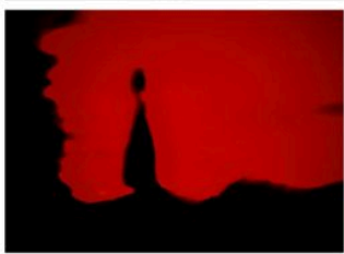
Quattro dettagli degli scatti notturni catturati dall'antropologo, fra cui "La Briga" in basso a sinistra

tornasse a sentire le manifestazioni della sua presenza come qualcosa di non controllabile? Che tipo di relazione si instaurerebbe se non ci fosse regola? C'è uno spazio in cui la natura di valle è incontrollata?».