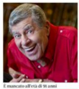
È mancato all'età di 91 anni

www.jorgepanchoaga.com www.sustainablemountainart.ch www.verzascafoto.com