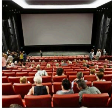
470 POSTI La sala di proiezione del rinnovato cinema Rex di Locarno