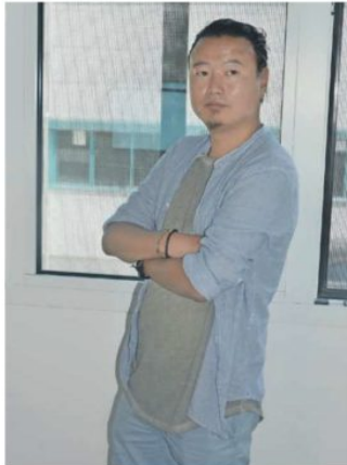
Leben, «Fotografie ist mein Leben», sagt der mongolische Fotograf Tamir Bayarsaikhan.

Im Gespräch mit dem mongolischen Fotografen ist spürbar: Tamir Bayarsaikhan fühlt sich in Bellwald wohl. Was er seinen Freunden zu Hause über die Schweiz erzählen wird? «Ich werde ihnen berichten, was das Leben in der Schweiz ist, was meine Heimat von diesem Land unterscheidet», führt er aus. Wird er denn eines Tages wiederum in der Schweiz anzufragen sein? «Ich glaube schon, dass ich irgendwann hierher zurückkomme», gibt er sich überzeugt. Und da er gerne reist, wird dies sicherlich geschehen.