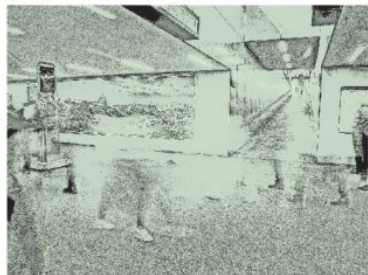
Schwarz-Weiss. Eine Arbeit von T. Bayarsaikhan: Schwarz-Weiss wird bevorzugt.

Wer als Gastkünstler bei artbellwald.ch weilt, führt jeweils einen «Tag des offenen Ateliers» durch. Tamir Bayarsaikhan tut dies am Samstag, dem 30. Juni. Zwischen 10.00 und 18.00 Uhr bietet sich im Atelier Kirchstrasse 1 in Bellwald Interessierten die Gelegenheit, den Fotografen aus der Mongolei kennenzulernen und seine in Bellwald entstandenen Arbeiten zu entdecken. Bald einmal werden Fotoarbeiten von Tamir Bayarsaikhan zudem im Ermer Kaplaneihaus ausgestellt. «Shadow on us» lautet der Titel der Werkschau, die am Samstag, 2. Juli, um 19.00 Uhr ihre Eröffnung feiert. Diese Ausstellung kann dann bis zum 16. September täglich zwischen 10.00 und 18.00 Uhr – bei Konzerttagen von Musikdorf Ermen bis 20.00 Uhr – besucht werden. «Die vom mongolischen Fotografen erhaschten Bilder sind mal atmend, mal schon von erheblicher Ruhe, mal unruhig, wirr und jungen dramatischer Ereignisse», heisst es zu «Shadow on us» von Tamir Bayarsaikhan.